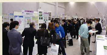
前回開催時(2016年1月19日・20日)の様子

切削、表面処理、金型、樹脂、鍛造・鋳造 プレス・板金、電気・電子、設備・装置 他 「航空・宇宙産業」特別ゾーンを新設! ※航空宇宙産業界に提案したい技術・製品を展示します